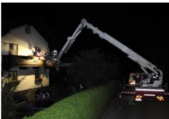
Personenrettung mit dem Hubsteiger

zerweg Jenbach. Da in dem Einfamilienhaus das Stiegenhaus sehr eng und steil war, entschloss sich der Notarzt, die Bergung mittels Hubsteiger durchführen zu lassen. Am Einsatzort angekommen wurde unverzüglich mit dem Zusammenbau der Korbtrage begonnen und diese am Korb montiert. In weiterer Folge wurde der Balkon im ersten Stock angefahren und der Patient schonend eingeladen. Am Boden konnte der Patient wieder dem Roten Kreuz übergeben werden, das sich dann auch unverzüglich in Richtung Krankenhaus Schwaz auf den Weg machte. Nach einer halben Stunde konnte der Einsatz beendet werden und die Mannschaft wieder ins Gerätehaus zur Fire Mania einrücken!!!!