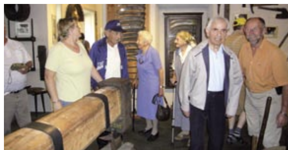
Altersheimbewohner waren zur Museums-Besichtigung und anschließender Jause eingeladen