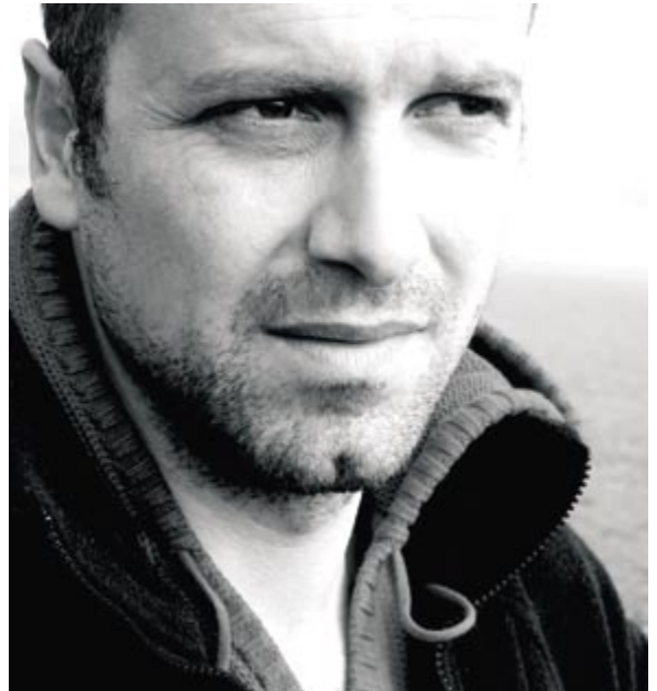
Bernhard Aichner liest aus seinem neuen Buch „Schnee kommt“

Der bekannte Tiroler Schriftsteller Bernhard Aichner macht den vorläufigen Abschluss des freiraum-Jahres mit einer Lesung aus seinem neuen Buch „Schnee kommt“ - am 22.11.2008 um 20.15 Uhr .