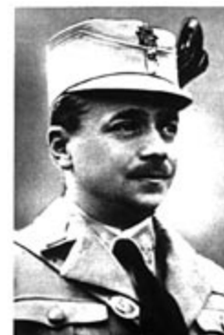
Engelbert Dollfuß (1892 - 1934) in der Uniform der Österreichischen Sturmsharen