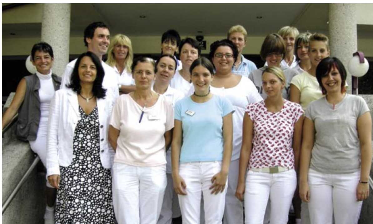
Die MitarbeiterInnen des Altersheimes

Das Jenbacher Altersheim verfügt über eine haus-eigene Küche und dadurch können gesunde, ab-