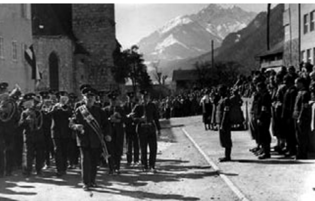
Feierlichkeiten zum Anschluss Österreichs an das Deutsche Reich