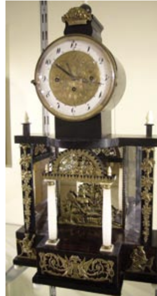
Uhrenaussstellung im Museum