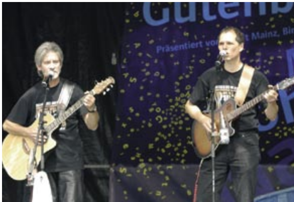
„Norfolk & Goode“, ein britisch-deutsches Rhythm'n'Blues Kabarettduo

Hinter Norfolk & Goode verbirgt sich ein hervorragendes und ausgesprochen humorvolles britisch-deutsches Rhythm'n'Blues Kabarettduo. Mit ihrem „Best-of“ Programm „Bluesography“ entführten die beiden „hervorragenden Sänger und Gitarristen“ (Zitat aus der Blues-News, Deutschlands größter Fachzeitschrift für Blues) ihre Zuschauer für drei Stunden in die Welt des englischen Humors und bewiesen mit einem energiegeladenen Programm, dass melancholische Songtexte und satirischer Wortwitz kein Widerspruch sein müssen.