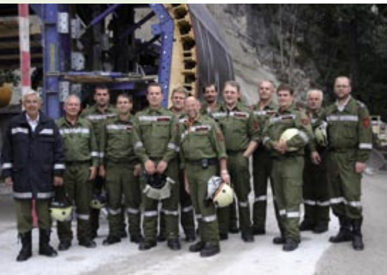
Besichtigung des Tunnelvortriebes in Wiesing

Funktionäre der beiden Wehren vom Bauleiter sowie von einem Polier. Nach ca. einer dreiviertel Stunde war die Besichtigung beendet und man konnte mit größerem und detaillierterem Wissen wieder ins Gerätehaus einrücken! Danke an die Belegschaft der Arge Tunnel Baustelle Wiesing für die sehr interessante Führung.