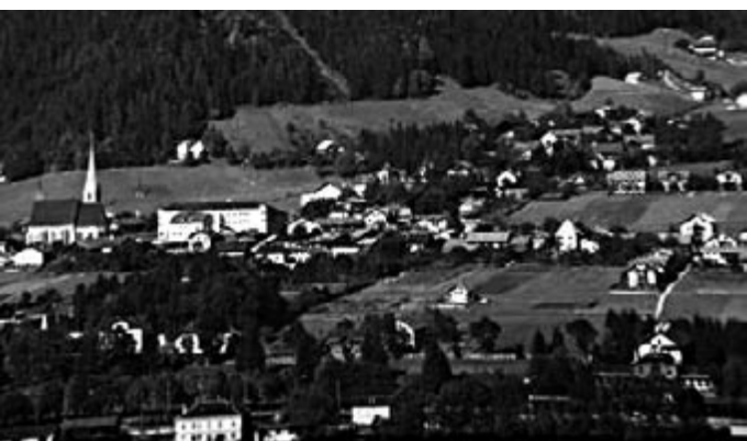
Blick auf das Ortszentrum

Es besteht eine Ortsgruppe des Kaiserschützenbundes. Die Feuerwehr wird in den Luftschutzdienst eingebunden.