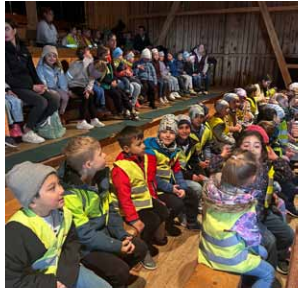
Theaterbesuch im „Steudltenn“ in Uderns

Ein weiteres Erlebnis wird die Exkursion zur Feuerwehr mit den Schulabgängern werden – es erwarten uns Theorie, Spritzübungen und eine Fahrt mit