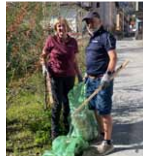
Die Neue Mitte Jenbach