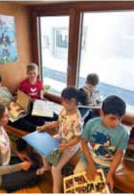
In der Markt- und Schulbücherei jen.buch

Das Team des Kindergartens Tratzbergsiedlung