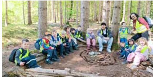
Einsatz im Gemeindegarten beim Freiwilligentag