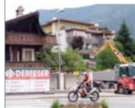
Abriss Juni 2019