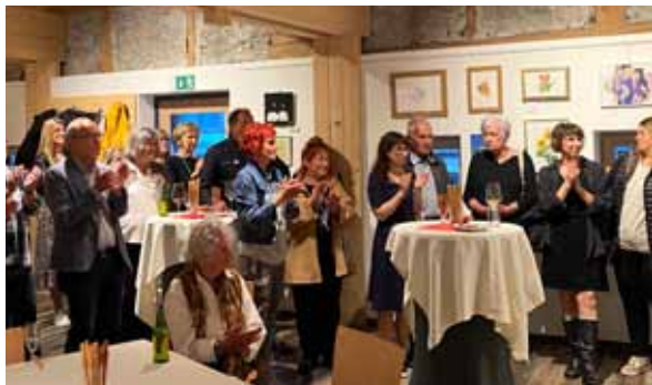
Zahlreiche Besucher bei der Vernissage am 9. Mai