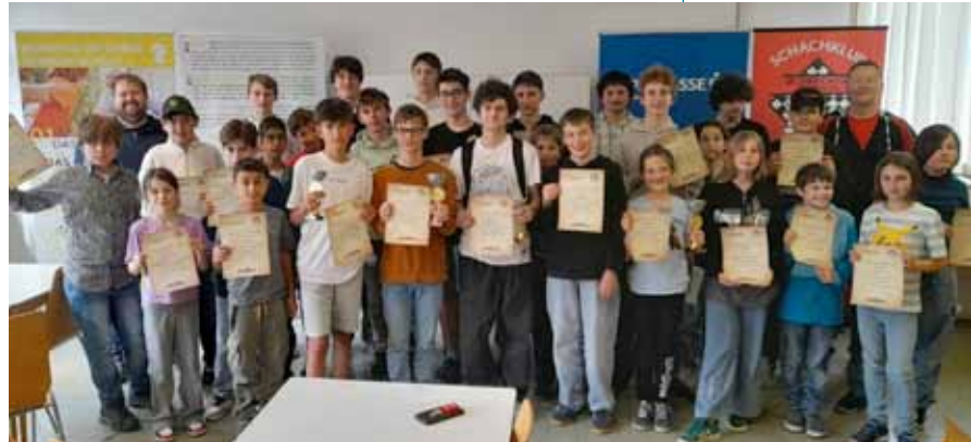
Jugendschachrallye Gruppe A