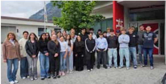
Die "Young Volunteers" der PTS Jenbach