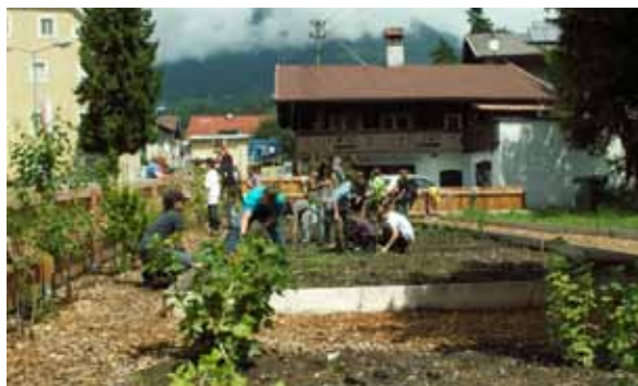
Baumschule im Garten (2010)

Mag a Monika Singer / für das Chronikteam