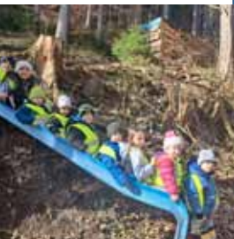
Spaß im Wald