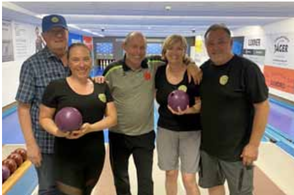
Bei der Marktmeisterschaft Kegeln war die Narrengilde heuer mit 2 Tengl Tengl Teams vertreten

Am 30. Oktober 2025 sind dann alle Mitglieder zur Jahreshauptversammlung mit Neuwahlen eingeladen. Wir freuen uns, im Zuge der Versammlung auch wieder Ehrungen für 10 Jahre unterstützende Mitgliedschaft bei der Narrengilde durchzuführen. Die Geehrten erhalten eine eigene Einladung und ein Ehrengeschenk.