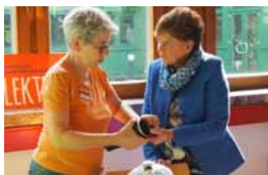
Repair Café Jenbach