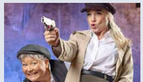
22.10. Zwei wie Bonny und Clyde . vz.jenbach