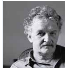
Vorschau: In Memoriam Werner Pirchner - am 5. Dezember 2025

Auf der Basis dieses wandlungsfähigen historischen Materials entstehen neue Stücke, in denen der unmittelbare musikalische Ausdruck im Zentrum steht - selbst die Hämmer des Klaviers beginnen zu singen.