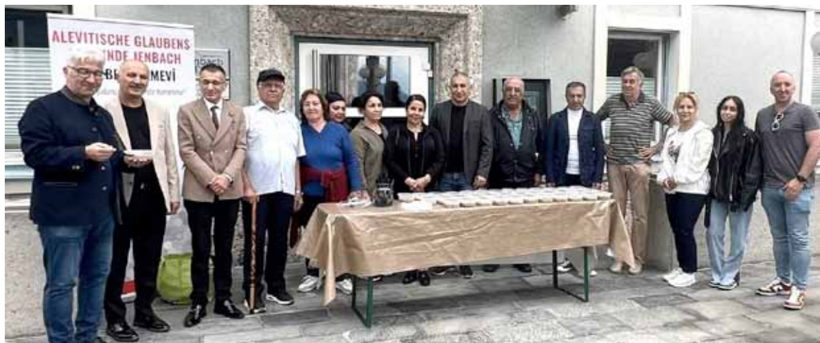
Öffentlicher Aschura-Tag mit Verteilung der "Noahsuppe"