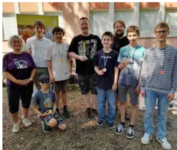
Mannschaftsfoto Jugend-Schnellschach-Rallye in Kufstein

In der Teamwertung landete Jenbach ebenfalls auf dem Podest – Platz 3 hinter SK Telfs und Schach ohne Grenzen.