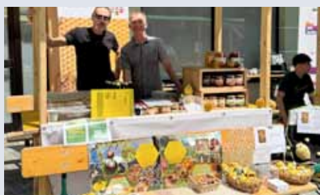
19.09. + 17.10. Schmankermarkt . Begegnungszone