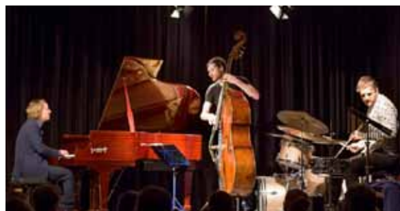
Das Trio Rotwelsch

Auf der Basis dieses wandlungsfähigen historischen Materials entstehen neue Stücke, in denen der unmittelbare musikalische Ausdruck im Zentrum steht - selbst die Hämmer des Klaviers beginnen zu singen.