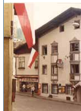
Festlich dekoriert zur Markterhebung im Jahr 1982