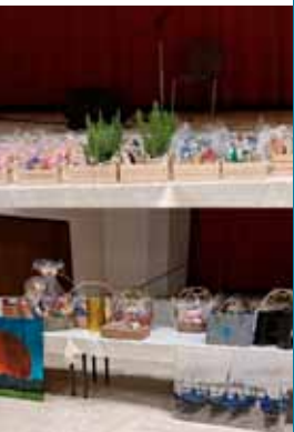
Mannschaftspreise und Tombola

Das zweite Jubiläum und Höhepunkt des Jahres war die 10. Marktmeisterschaft im Kegeln. Mit 45 Mannschaften konnte ein neuer Rekord aufgestellt werden. Gute Stimmung, Spaß am Kegeln und sportlicher Ehrgeiz prägten das Turnier. Dass der Marktmeister aus dem Mittelwert ermittelt wurde, ließ viele auf eine gute Platzierung hoffen. Sieger wurde die Mannschaft „Binderholz“ mit 700 Holz (zum ersten Mal dabei) - sie kam am nächsten zum Mittelwert von 697,38 Holz. Der zweite Rang ging an die „Watterkönige“ mit 691 Holz und der dritte Rang an die Mannschaft „Fit und Flott 2“ mit 705 Holz.