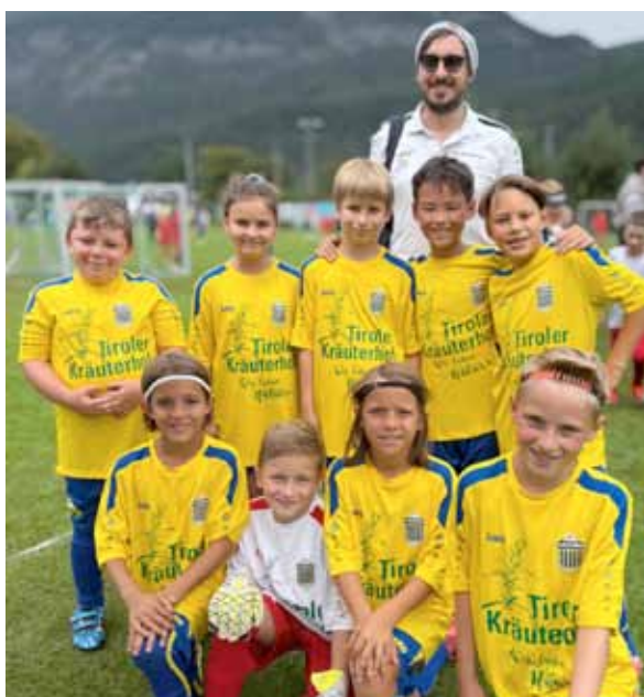
U11: Unsere Kids bei einem Turnier

Wie schon in den vergangenen Jahren konnte der SK Jenbach auch heuer wieder internationale Top-Mannschaften begrüßen. Neben der Nationalmannschaft der Vereinigten Arabischen Emirate gastierten Vereine wie US Lecce, FC Heidenheim, VfL Osnabrück, RC Strasbourg, Eintracht Braunschweig, Istanbul Başakşehir FK, FC Viktoria Plzeň, FK Jablonec und FC Botoşani bei uns. Diese internationalen Gäste schätzen besonders die ausgezeichneten Platzverhältnisse und das familiäre Umfeld. Der Dank gilt hier vor allem unseren vielen freiwilligen Helfer*innen, die mit ihrer Einsatzbereitschaft und Gastfreundschaft für ein besonderes „Jenbach-Gefühl“ sorgen – viele Teams kommen deshalb gerne jedes Jahr wieder. Uns als Verein erfüllt es mit Stolz, dass wir so dazu beitragen können, die Marktgemeinde Jenbach international sichtbar zu machen.