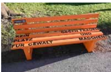
„Orange the World“