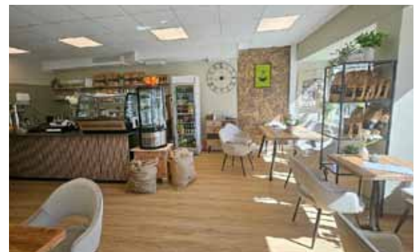
Das neue Café Memories mit Terrasse direkt am Kasbach

Auch in der Gastronomie tut sich einiges: Mit der Eröffnung des Cafés Memories mit einer gemütlichen Terrasse direkt am idyllischen Kasbach hat die Zone einen neuen Treffpunkt gewonnen. Zusammen mit dem Frühstückscafé Filos laden nun zwei charmante Lokale zum Verweilen und Genießen ein.