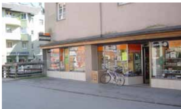
Pesserer nach 1996

Mag a Monika Singer / für das Chronikteam