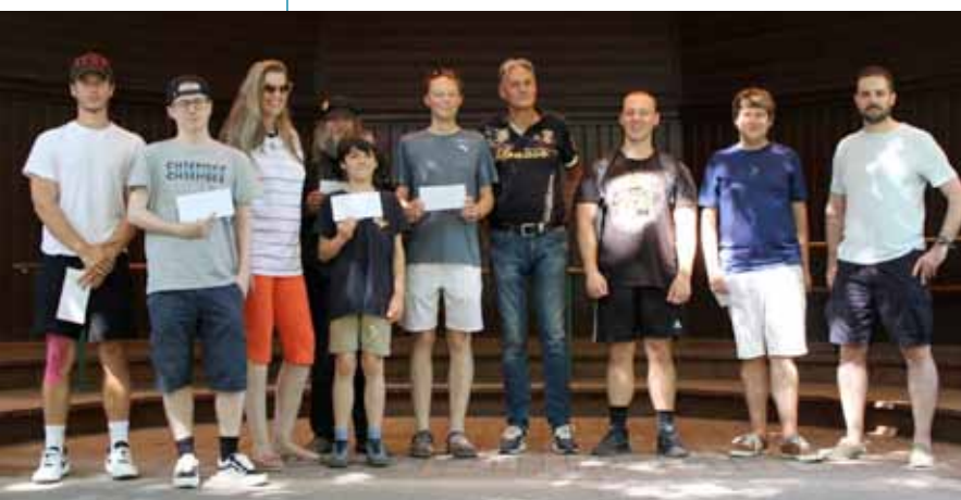
Siegerfoto Schlossbergblitzturnier Rattenberg