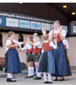
Tiroler Abend mit der Bundesmusikkapelle Jenbach