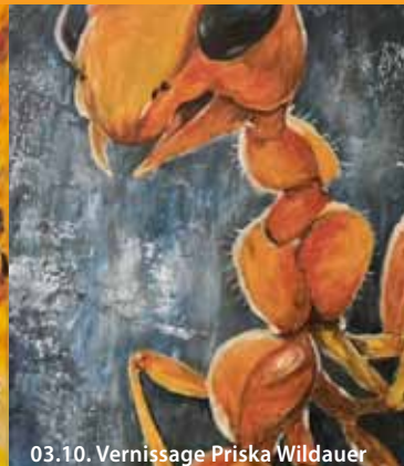
03.10. Vernissage Priska Wildauer