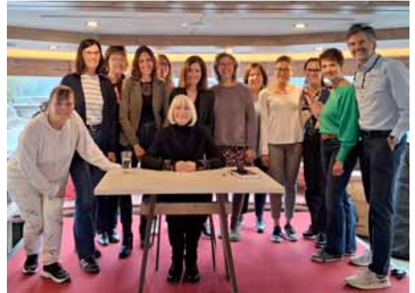
Lesung mit Erika Pluhar

Und für alle, die gerne spielerisch lernen: Unser Edurino-Figuren sind neu im Verleih . Die kleinen digitalen Lernbegleiter verbinden Spaß mit Wissen und sind ab sofort bei uns ausleihbar – ideal für Kinder im Vorschul- und Grundschulalter. Wir freuen uns schon auf die nächsten Veranstaltungen – und natürlich auf viele neugierige Leser*innen.