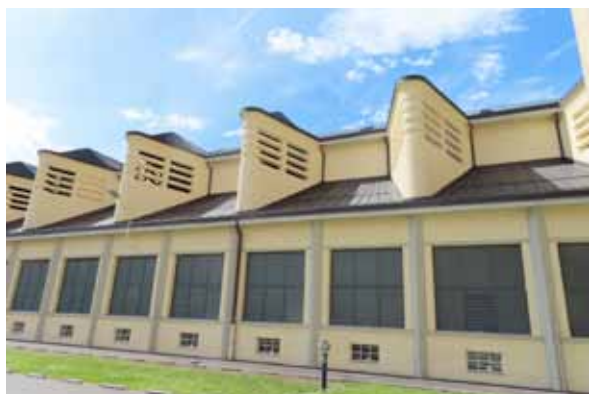
Achenseekraftwerk, Foto: Erika Felkel

Saisonabschlussfest im Jenbacher Museum am Samstag, 25. Oktober von 10.00 bis 17.00 Uhr Kulinarisch werden wir Euch mit Grillspezialitäten, Zillertaler Krapfen, Kaffee und Kuchen versorgen. Ein Flohmarkt (wir bitten um Anmeldung unter der Telefonnummer 0664/9517845) mit Bücherverkauf zu günstigen Preisen ergänzt das Angebot. Kinder können die alten Jenbacher Kirchen-Orgelpfeifen im Krippenraum ertönen lassen. Die Sonderausstellung „Siegfried Mazagg und der Bau des Achenseekraftwerkes“ mit Karikaturen und Originalplänen ist noch bis Ende des Museumsjahres zu sehen.