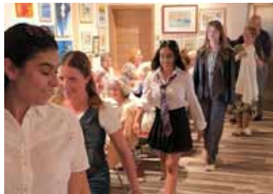
Modenschau in der Plauderstube