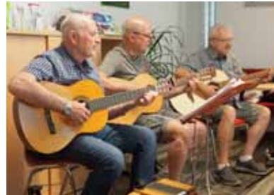
"Singen is insa Freid"