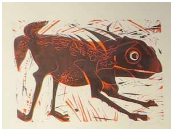
„Hundsfisch“ von Reiner Schiestl