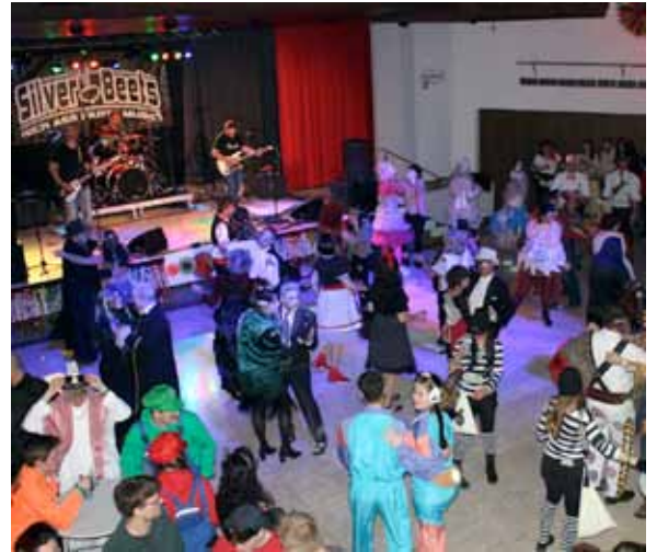
Faschingsball 2025 – danke allen für die super Stimmung und die tollen Maskierungen

2024 haben wir - nach 7 Jahren - wieder die Tradition des Faschingsballes im VZ aufgenommen. Herzlichen Dank für die vielen positiven Rückmeldungen für die ersten zwei Bälle - wir haben uns sehr darüber gefreut.