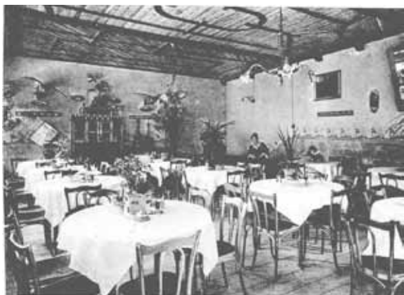
Glasveranda beim Stern

Postkarte aus dem Jahr 1912