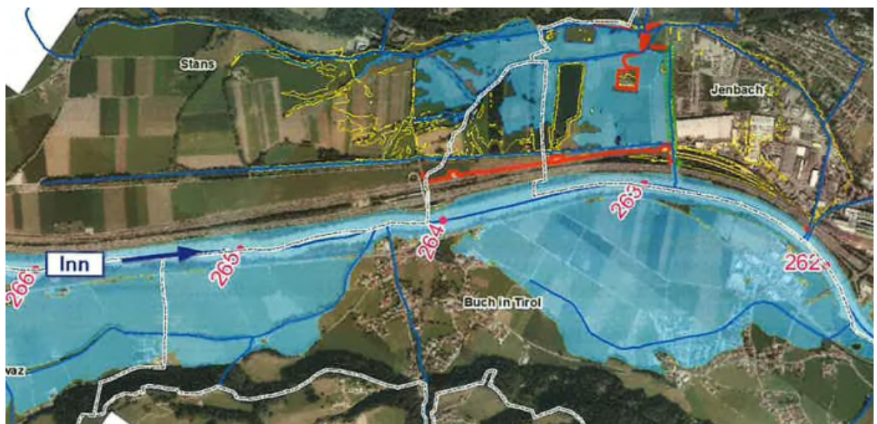
Abbildung 4: Projektgebiet Einreichprojekt Bauabschnitt 01, Überflutungsflächen HQ100 Planzustand mit AL HQ100 Bestand (Maßnahmen Tiwag grün, HWS im Rückhalteraum rot)

Innerhalb des Gesamtprojektes werden Bauabschnitte abgegrenzt, Bauabschnitt 01 beinhaltet die Hochwasserschutzmaßnahmen in der Gemeinde Jenbach und Maßnahmen zum Ausbau einer natürlichen Rückhaltefläche in den Gemeinden Jenbach, Stans und Buch in Tirol. Bauabschnitt 07 erstreckt sich von Inn Flusskilometer 266,10 bis Flusskilometer 262,00.