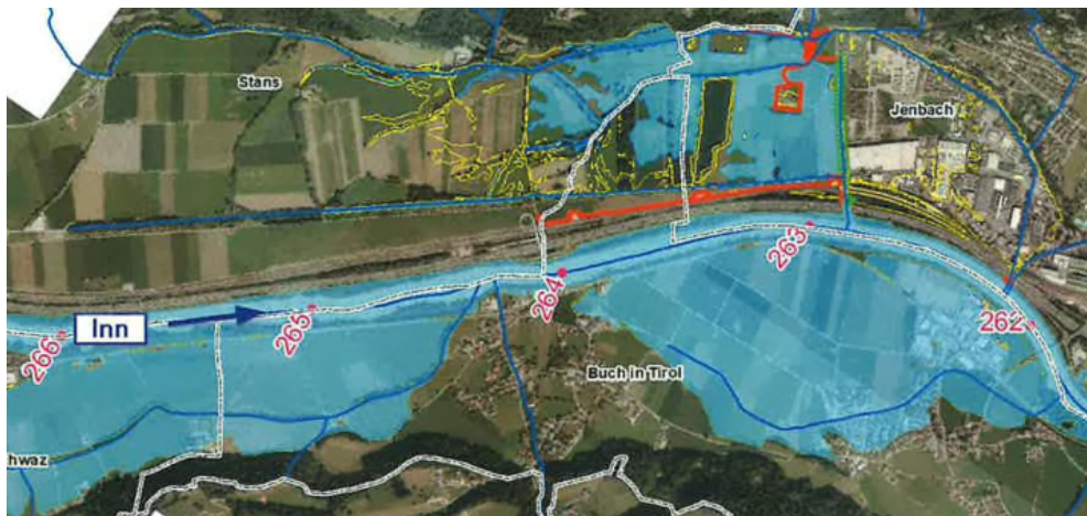
Abbildung 2: Projektgebiet Einreichprojekt Bauabschnitt 01, Überflutungsflächen HQ100 Planzustand im AL HQ100 Bestand (Maßnahmen Tiwag grün, HWS im Rückhalteraum rot)

Im gegenständlichen Bericht ist der Planungsbereich TIWAG nur insofern beschrieben, als die Funktion der Maßnahmen im Planungsbereich TIWAG für das Gesamtprojekt von Bedeutung ist.