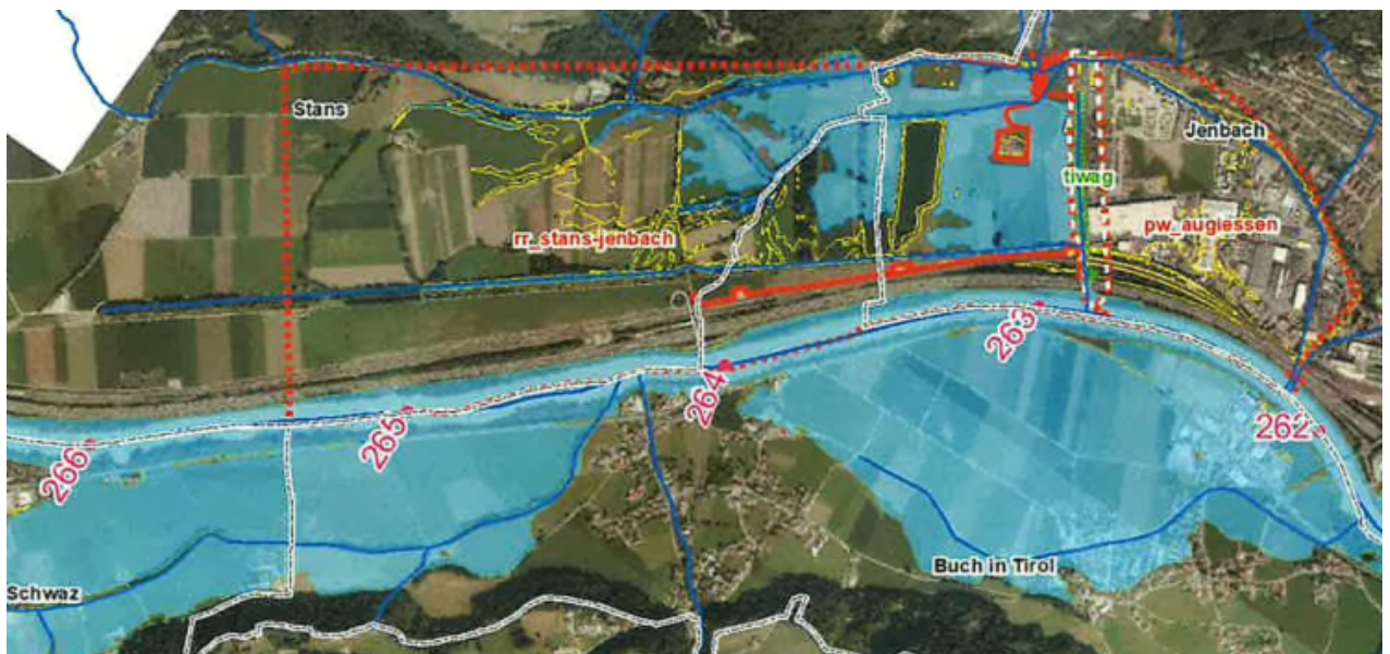
Abbildung 3: Planungsabschnitte/Übersichtskarte

Der Rückhalteraum Stans - Jenbach befindet sich östlich des Teilabschnittes Pumpwerk Augiessen und umfasst Flächen auf den Gemeindegebieten von Stans, Buch in Tirol und Jenbach.