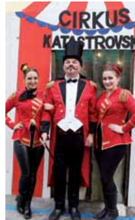
Den Höhepunkt des Faschings bildete wie immer der „Un-sinnige Donnerstag“- Tengl-Tengl. Kulinarisch verwöhnt wurden die Narren durch Angebote verschiedener Vereine. Beate Widner / Marktgemeinde Jenbach