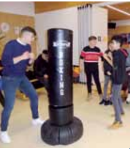
Der Box-Sack kommt gut an