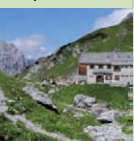
"Auf den Bergen"