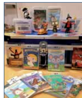
Neue Tonies sind eingetroffen