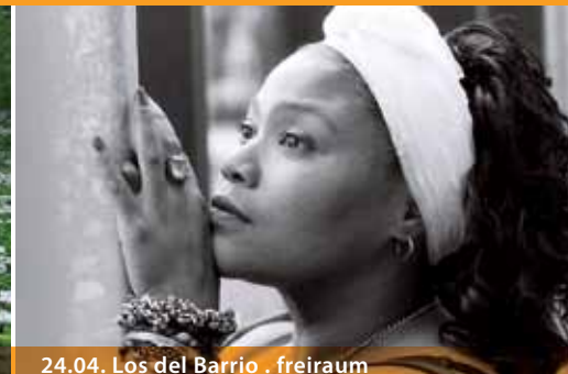
24.04. Los del Barrio . freiraum