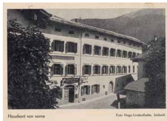
Hauptfront von vorne