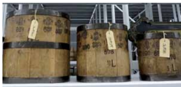
Eichmaße für Fassbinder, Foto: Volkskunstmuseum

Die Besucher sollen sehen, was früher alles nur mit der Hand gemacht wurde. Ergänzt wird die Ausstellung mit Filmvorführungen. Robert Moosmann wird am Eröffnungstag vorführen, wie Gläser graviert werden, die auch erworben werden können.