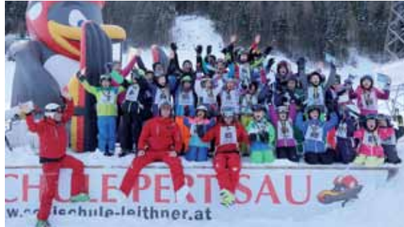
Nach der Siegerehrung