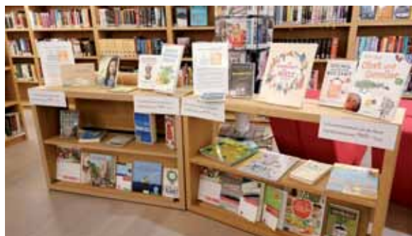
Filme und Bücher zur UN-Agenda 2030