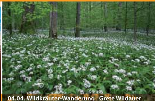
04.04. Wildkräuter-Wanderung . Grete Wildauer