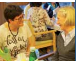
Inka und Rose im Gespräch