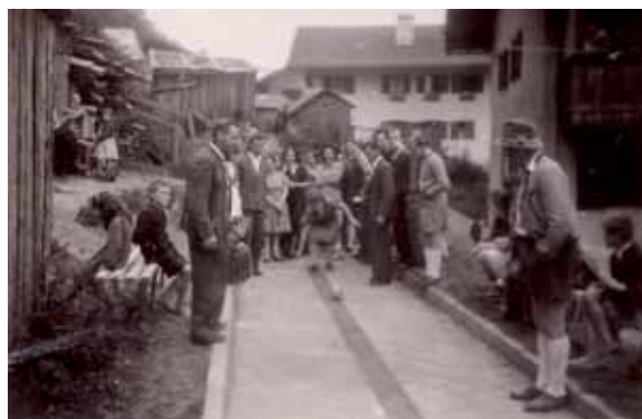
Kegelbahn in der Tratzbergsiedlung, ca. 1950, von den Südtiroler Optanten gebaut