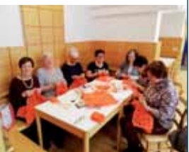
Die Häkelrunde macht Sitzpolster für die Mitfahrbank