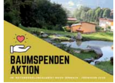
Neujahrscafé mit den Freiwilligen im JES Plauderstube Jänner - Vortrag Hospiz Tirol Ein Dankeschön für die Baumspenden