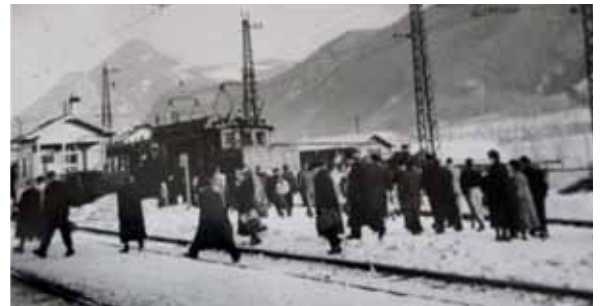
Der Bahnhof Jenbach im Jahr 1954 – ohne Bahnsteige

mich hervorragend ein - eigene Kassiere waren von 6 Uhr bis 22 Uhr im Dienst.