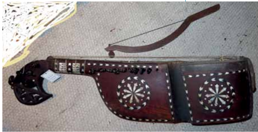
oben: Rebab-Fidel, Asien, rechts: Horn, Blechblasinstrument, um 1880, Unikat, Fotos: Erika Felkel

führerin zu übernehmen, die dem Verein nun als deren Stellvertretung zur Verfügung stehen wird. Am Schluss gab der Historiker Mag. Ivan Stecher Einblicke in seine Forschungsarbeit über die Optionsgeschichte der Südtiroler.