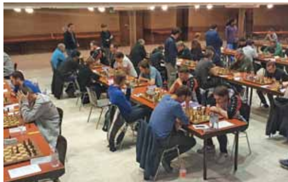
1. Bundesliga zu Gast in Jenbach

Stefan Widner / Schachklub Sparkasse Jenbach