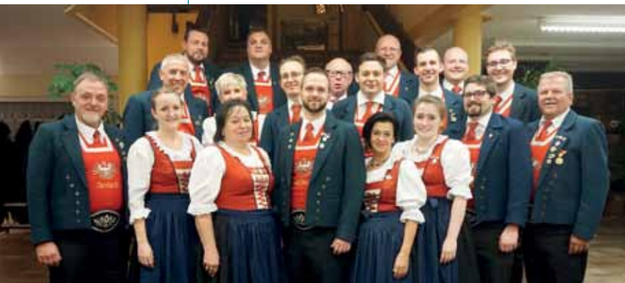
Der neugewählte Vorstand startet motiviert in die neue Funktionsperiode