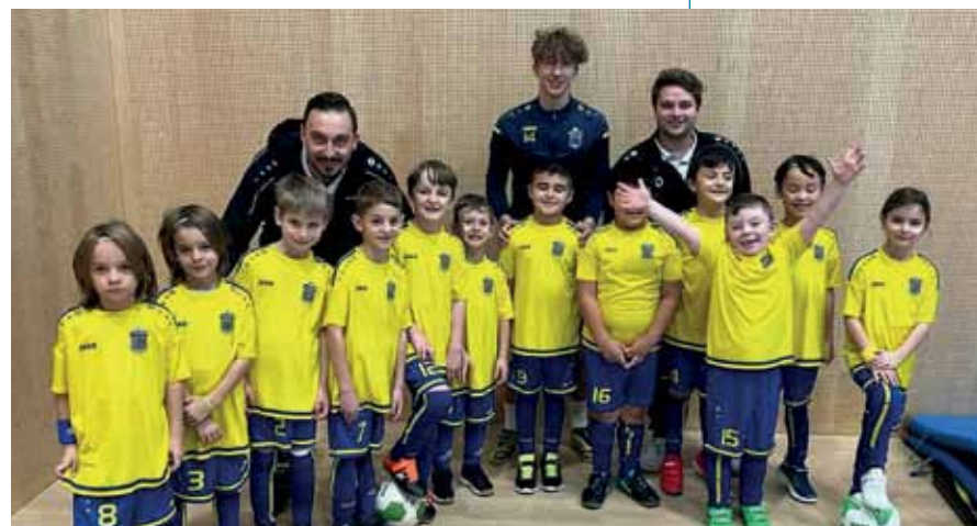
U8: Erfolgreiche Hallensaison für unseren Nachwuchs

Wer meint, dass es in den Wintermonaten ruhig zugeht beim SK Jenbach, der hat sich getäuscht. Während die Kampfmannschaften nach der erfolgreichen Herbstsaison – die Jenbacher Erste steht vor Beginn der Rückrunde auf Rang zwei der Tabelle und damit in einer mehr als guten Position – tatsächlich über den Winter verdienstermaßen etwas kürzertraten , freute sich die große Jenbacher Nachwuchsabteilung über die erste vollständige Hallensaison nach zwei Jahren pandemiebedingter Einschränkungen. In den von unseren ausgebildeten Nachwuchstrainer*innen bestens vorbereiteten Halleneinheiten feilten die Jungs und Mädels nicht nur an ihrer Technik, sondern erlebten auch viel Abwechslung bei Spiel und