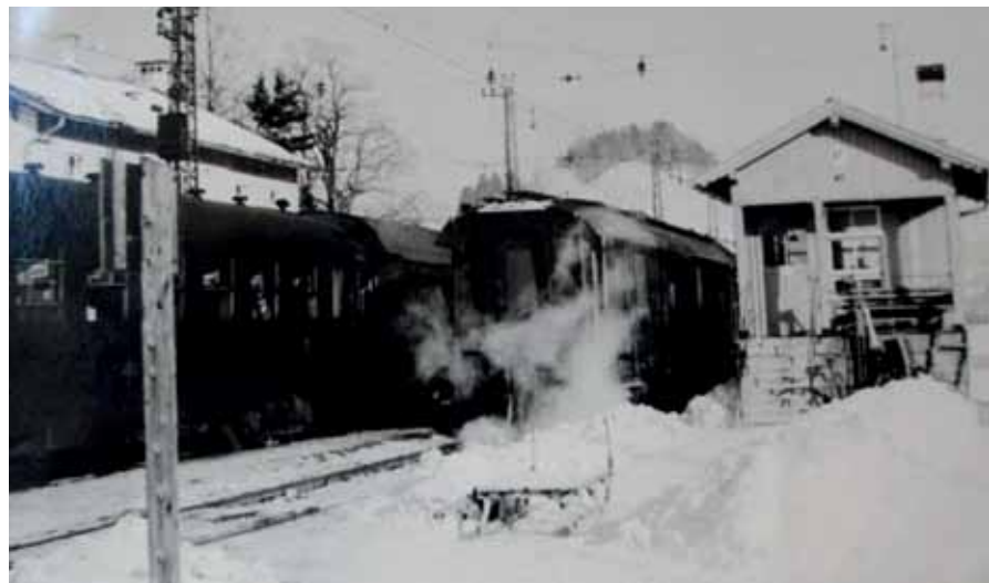
1954: Stellwerk in Bahnhofmitte

Eine besondere, immer wieder vorkommende Situation ist mir gut in Erinnerung: Es gab ja noch keine Autobahn und die damaligen Personenzugwagen benötigten von Innsbruck bis Jenbach, mit der Durchfahrt durch alle Ortschaften, ungefähr 1 Stunde Fahrzeit. Der letzte Personenzug abends fuhr um 24 Uhr von Innsbruck nach Wörgl ab. In der Landesregierung wurde jedoch oft länger