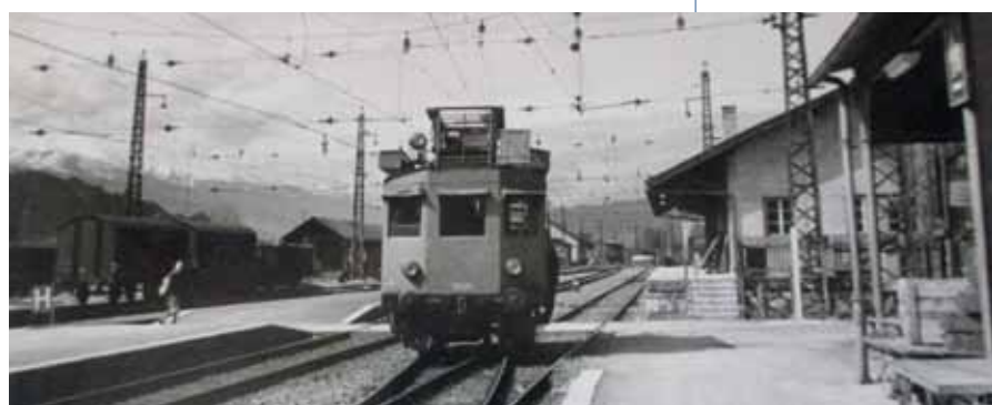
Bahnhof Jenbach im Jahr 1958 mit dem alten Magazin rechts im Bild