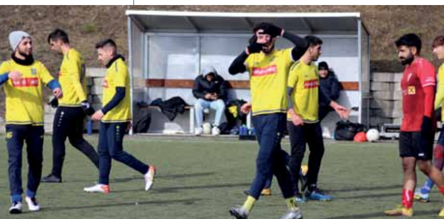
Sieg im Testspiel gegen den SV Thaur