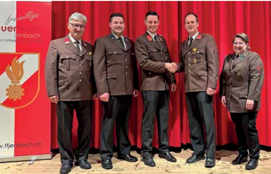
Das neue Kommando