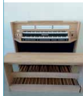
Die neue Sakralorgel

musikwettbewerb "prima la musica" im Südtiroler Toblach, zu dem wir zehn Teilnehmer*innen entsenden und in einem regionalen Preisträgerkonzert gemeinsam mit den Landesmusikschulen