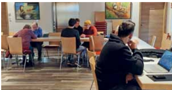
Die Welt des Smarthphones

Die Bilder der Botschafter*innen sind jetzt im Somweberhaus im Mehrzweckraum ausgestellt. Im Rahmen meiner Sprechstunden - immer am Mitt-