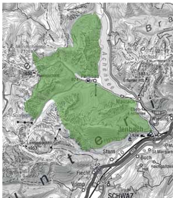
Wegebetreuungsgebiet des AV Jenbach

In vielen Bereichen des Wegenetzes mussten umfangreiche Reparatur-, Ausschneide- und Markierungsarbeiten durchgeführt werden, sodass 30