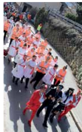
Den Höhepunkt des Faschings bildete wie immer der „Un-sinnige Donnerstag“- Tengl-Tengl. Kulinarisch verwöhnt wurden die Narren durch Angebote verschiedener Vereine. Beate Widner / Marktgemeinde Jenbach