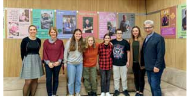
Die Vernissage zur Wanderausstellung

woch von 9.00 bis 12.00 Uhr im Somweberhaus - zeige ich Sie Ihnen gerne persönlich. Möchten Sie die Bilder auch in Ihren Einrichtungen für eine Zeit sichtbar machen? Melden Sie sich bei mir.