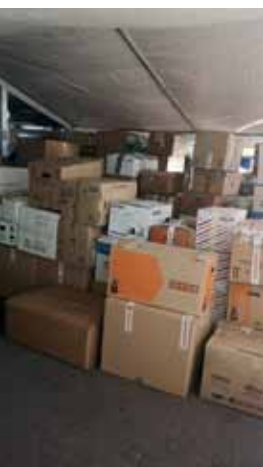
Viele Spenden konnten im Stadion eingesammelt werden