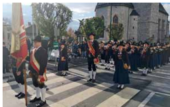
Umzug zu Ehren der heiligen Cäcilia

Vergangenen November konnte endlich wieder das höchste Fest im Musikjahr begangen werden: Mit einer Messe und einem kleinen Umzug wurde der Heiligen aller Musikschaaffenden, der heiligen Cäcilia , gedacht. Im Anschluss lud die BMK Jenbach alle Mitglieder mit Lebensgefährten sowie Gönner, Förderer und Partner zum traditionellen Hirschessen in den Gasthof Rieder ein. Im Zuge dessen konnten auch verdiente, langjährige Musikantinnen und Musikanten geehrt werden. Auch wurden die fleißigen (Jung-)Musikant*innen vor den Vorhang geholt, die durch Fleiß, Talent und harte Arbeit ein Leistungsabzeichen absolviert haben. Auf diesem Wege noch einmal herzliche Gratulation an die Leistungsabzeichen-Träger*innen.