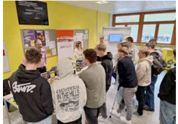
Büchertisch in der HTL Jenbach