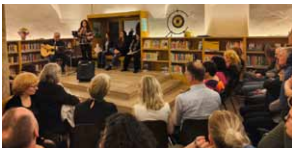
"Starke Frauen" am 8. März bei jen.buch