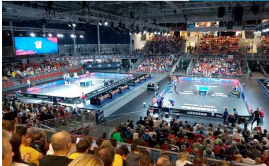
Überblick über die Halle in Linz

Die Stimmung in der Halle kann als äußerst fair und dennoch euphorisch bezeichnet werden. Es gab viele spannende und ausgeglichene Duelle