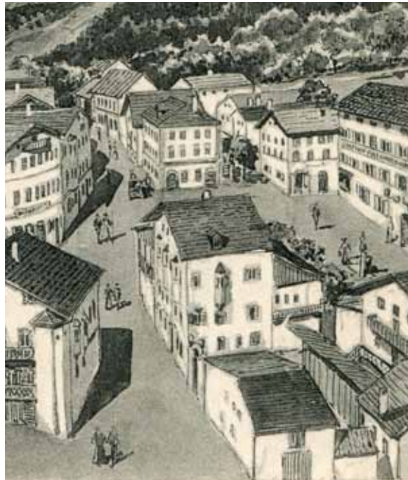
Ausschnitt aus einer Postkarte – Jenbach um 1900