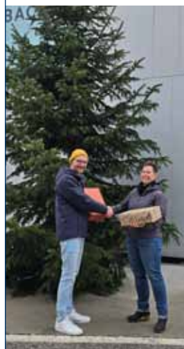
Aktion "Weihnachten im Schuhkarton"