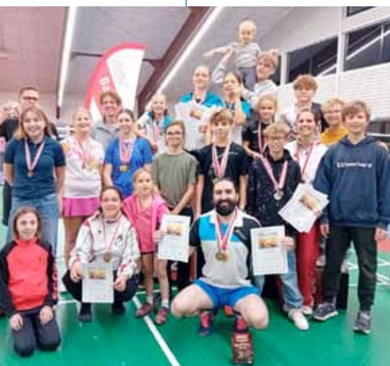
Die erfolgreichen Teilnehmer an den Tiroler Meisterschaften Allgemeine Klasse und Schüler 2024