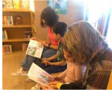
Lesecub für Kinder