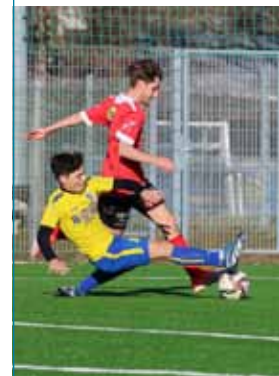
Spiel der 1B gegen den SV Sellraintal

Auch unsere Erwachsenen-Teams waren in der Halle aktiv. Unsere Damen erkämpften sich beim Hallenturnier des FC Bruckhäusl den sechsten