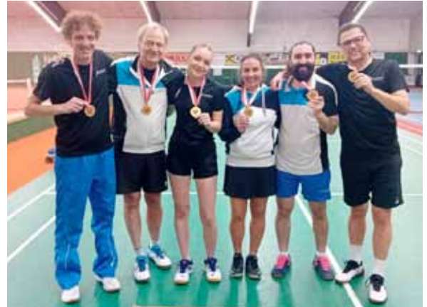
Tiroler Mannschaftsmeister 2024

2024, die Tiroler Meisterschaften der allgemeinen Klasse und Schüler in Nußdorf/Debant statt. Diese Meisterschaften endeten mit einer sensationellen Bilanz für den BC Jenbach: 11 x Gold, 9 x Silber und 10 x Bronze.