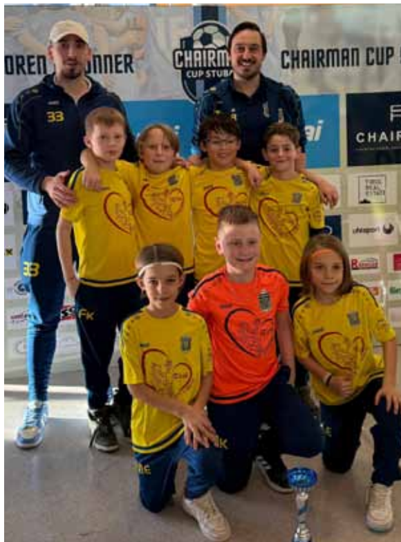
U10 beim Chairman Cup

Unsere Nachwuchsteams zeigten ebenfalls großartige Leistungen: Die U8 sammelte wertvolle Erfahrungen in Altsch, die U10 sicherte sich den ersten Platz beim Hallenturnier in Vomp, während die U9 in München einen tollen Turniertag erlebte. Besonders erfreulich war der Sieg der U8 beim Chairman Cup in Neustift, wo auch unsere U10, welche erstmals einen Jahrgang höher spielte, einen starken dritten Platz erreichte.