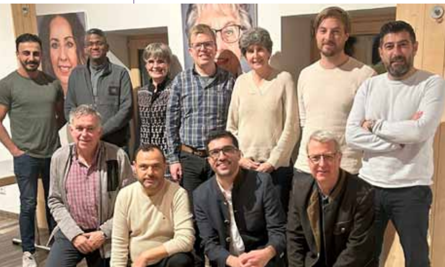
Austausch der Religionsgemeinschaften beim ersten Treffen

Die Marktgemeinde Jenbach hat gemeinsam mit den Religionsvertreter*innen der Region eine neue Plattform ins Leben gerufen. Ziel dieser Initiative ist es, den Austausch zwischen den verschiedenen Religionsgemeinschaften zu stärken, regelmäßige Treffen zu ermöglichen und gemeinsam Projekte umzusetzen.