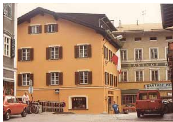
Die Apotheke in den 1970er Jahren und im Jahr der Markterhebung Jenbachs 1982