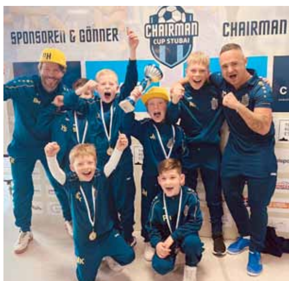
U8 beim Chairman Cup