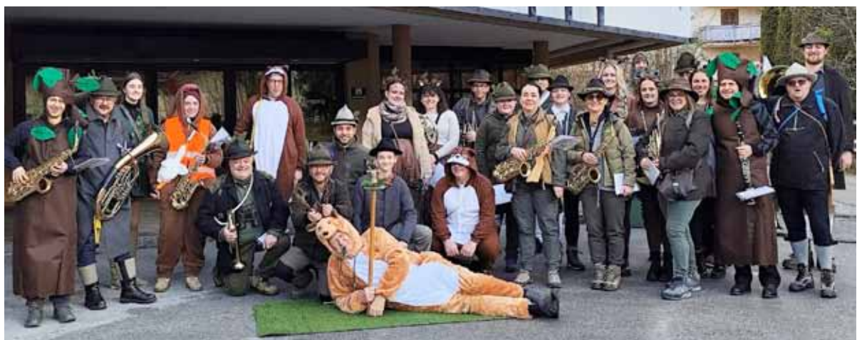
Die BMK am Unsinnigen Donnerstag