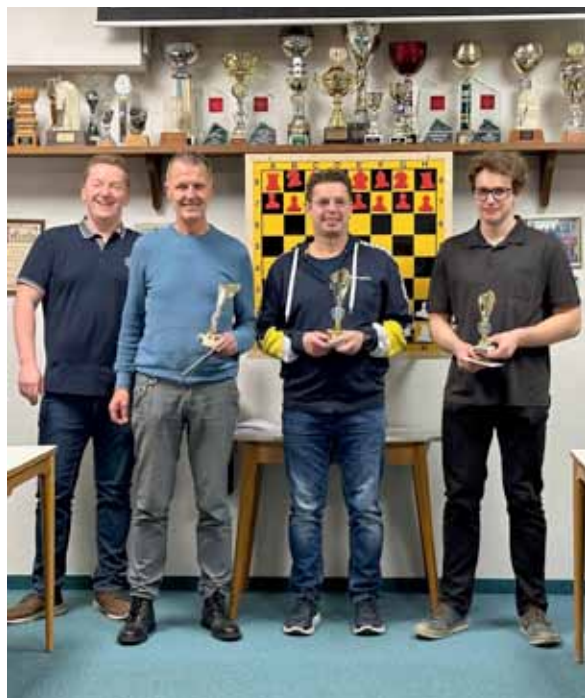
Siegerehrung Klubmeisterschaft 2024

die Ausbildung zum Schach-Instruktor erfolgreich absolviert. Dies ist ein bedeutender Schritt für die Weiterentwicklung unseres Trainingsbetriebes.