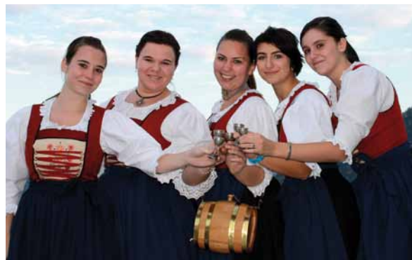
Wir sind auf der Suche nach fröhlichen und engagierten jungen Frauen als Marketenderinnen

Dagmar Knoflach / Pressebetreuerin BMK Jenbach