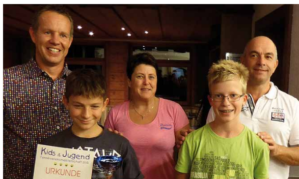
Jugendvereinsmeister U15 männlich