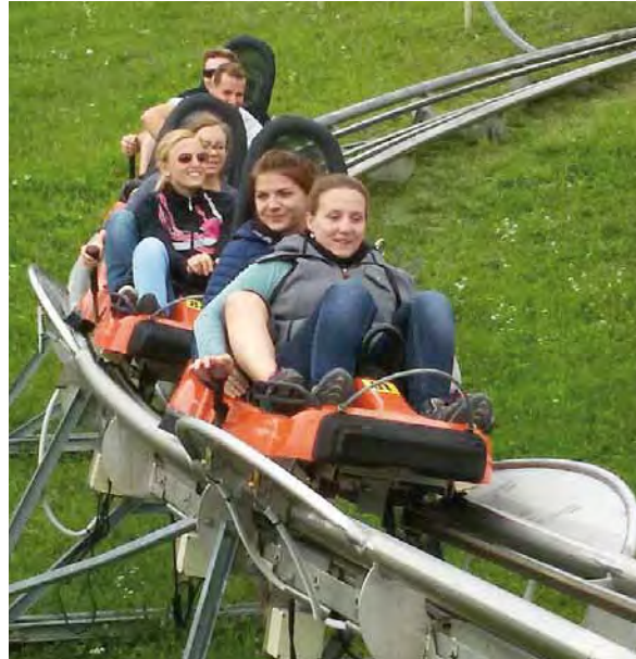
Die Jungmusikanten und Jungmusikantinnen hatten einen Riesenspaß auf dem Alpine Coaster

Am 13. September machte sich die Jugend der Bundesmusikkapelle Jenbach mit 22 Jugendlichen mit dem Bus auf Richtung Imst. Das Ziel: Der Alpine Coaster mit einer Länge von 3.535 Metern und somit die längste Sommerrodelbahn der Alpen. Am Vormittag wanderten alle zusammen zu Fuß zur Bergstation, welche auf einer Höhe von 1.500 Metern liegt. Dort angekommen gab es für jeden eine Stärkung in der „U-Alm“. Anschließend durfte jeder das erste Mal mit dem Alpine Coaster ins Tal fahren. Da es allen so gut gefallen hat, durfte natürlich jeder noch ein zweites Mal fahren. Nachdem alle sicher von den Zillertaler Verkehrsbetrieben nach Jenbach gebracht worden waren, gab es zur Abrundung des aufregenden Tages noch eine Pizza im Gusto.