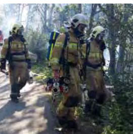
Waldbrand in Fischl

Rekordjahr! Heuer wurden bereits über 210 Einsätze von der Freiwilligen Feuerwehr Jenbach abgearbeitet, was einen neuen Einsatzrekord bedeutet. Neben zahlreichen kleineren Einsätzen (wie zum Beispiel der Aufzugstop am Bahnhof) waren auch einige große und vor allem herausfordernde Notfälle zu verbuchen. Am 30. März wurden wir zu einer Nachbarschaftshilfe nach Reith im Alpbachtal angefordert. Hier geriet ein Dachstuhl in Vollbrand. Am 21. August kurz vor 22 Uhr meldeten mehrere Bewohner einen Wohnungsbrand in der Badgasse. Angekommen stellte sich heraus, dass es sich um einen Küchenbrand gehandelt hat. Weitere Schäden durch Feuer und vor allem durch Wasser wurden verhindert, da ein schnelles und effizientes Eingreifen eine Frage des richtigen Einsetzens des Löschwassers ist.