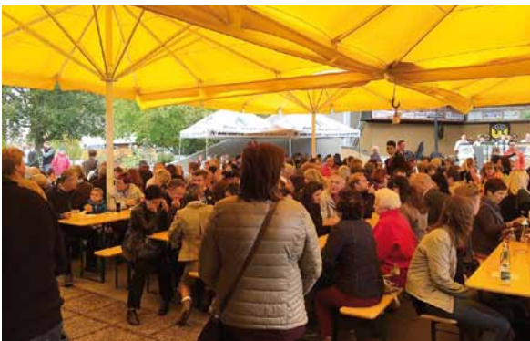
Das Oktoberfest nach der Erntedankprozession war sehr gut besucht

Der Herbst bot auch noch ein Fest der besonderen Art. Am 4. Oktober im Anschluss an die Erntedankprozession fand beim Musikpavillon das schon zur Tradition gewordene Oktoberfest statt.