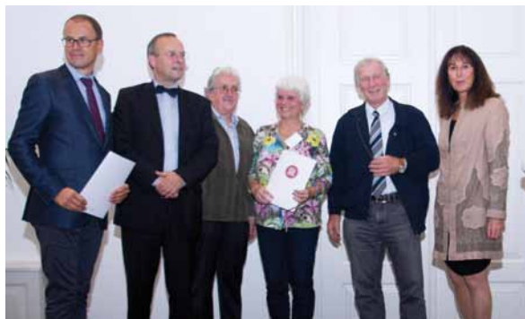
Überreichung des Gütesiegels durch die Vorstände des Österreichischen Museumsbundes

Der Wortlaut der Urkunde: „Das Jenbacher Museum erfüllt die geforderten nationalen und internationalen Museumsstandards.“