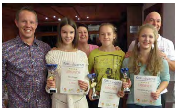
Jugendvereinsmeister U15 weiblich