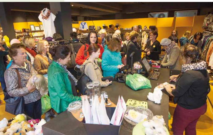
Die ersten KundInnen

Stöbern und Bummeln ein. „Second hand - first class“ ist das Motto des WAMS-Ladens und das findet sich wieder in der Qualität der Ware sowie in der Ausstattung des Ladens.