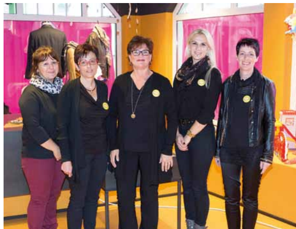
Das Team des WAMS Ladens Jenbach