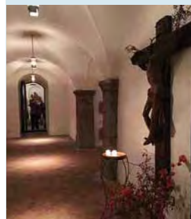
Die Innsbrucker Innenstadt - immer wieder einen Besuch wert