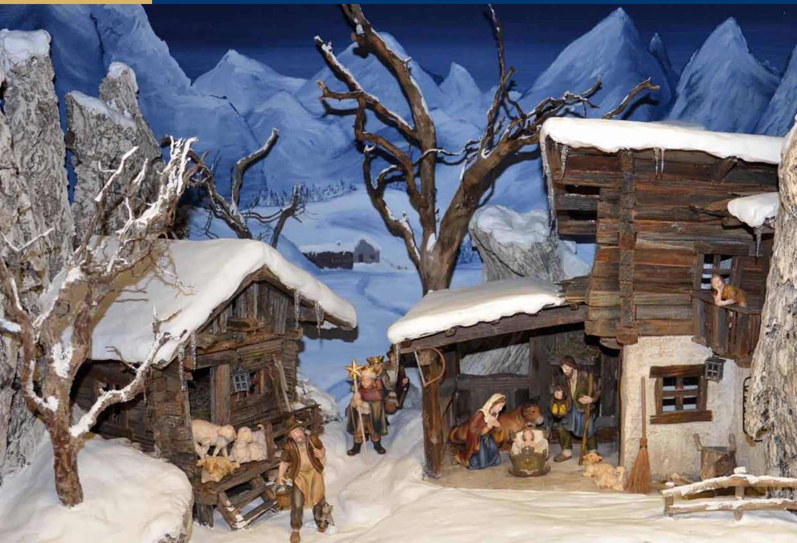
Schneekrippe von Petra Hechenblaickner