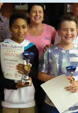
Jugendvereinsmeister U12 männlich