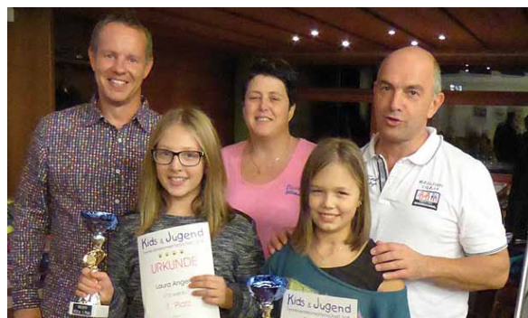
Jugendvereinsmeister U12 weiblich