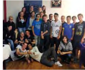
Zum Abschluss des Ausfluges gab es eine köstliche Pizza im Gusto