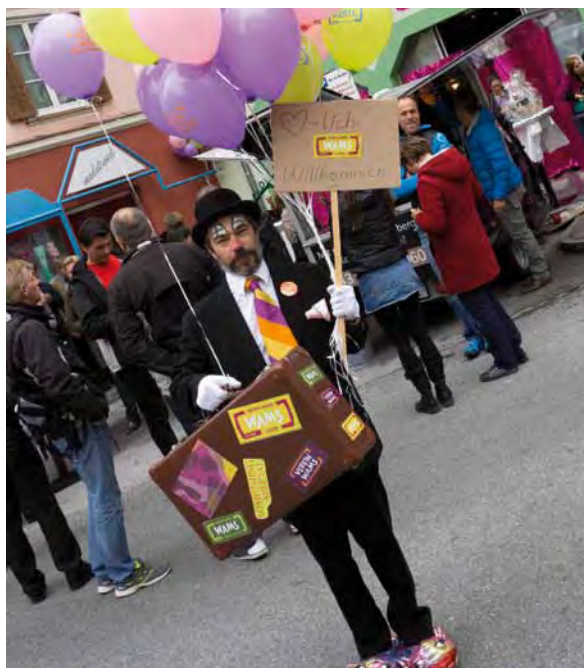
Der WAMS-Clown sorgt für Spaß